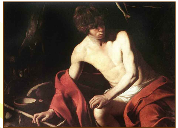
S. GIOVANNI BATTISTA - CARAVAGGIO

Ma con altrettanta lucidità la mistica e filosofa francese (1909 -1943) aggiunge:” La chiesa può essere brutta, i canti stonati, il prete corrotto e i fedeli distratti; in un certo senso questo non importa. Come non importa che un geometra, per fare una dimostrazione corretta, faccia un disegno in cui le linee non sono rette e i cerchi sono ovali”.