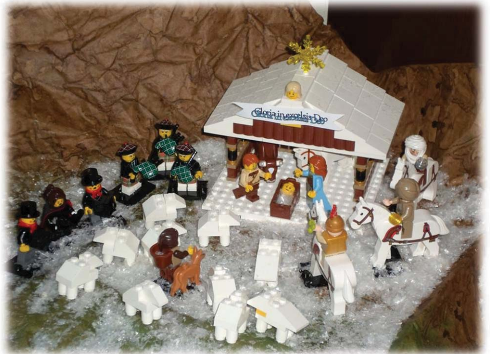
Un presepe "particolare", fatto con i Lego

Nelle case di Albairate si fa il presepe? In particolare, lo si fa nelle case dove ci sono i bambini? Verrebbe da rispondere di sì, a giudicare