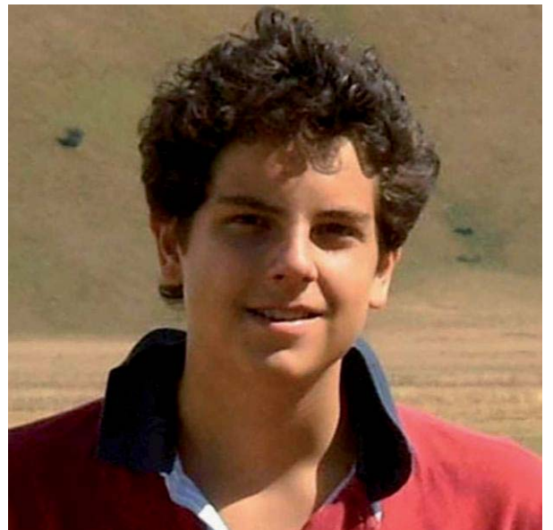
Carlo Acutis, beatificato il 10 ottobre

Un altro elemento che possiamo cogliere come uno stato d'animo imperante trasversale a tutta la società odierna è il lamento . Le cose non funzionano e noi ci lamentiamo: d'altra parte è tipico del nostro tempo. Tuttavia dobbiamo notare che a furia di lamentarsi si diventa tristi, incattiviti. Al massimo si trova qualche risata di sfogo sulle stesse cose che a guardarle bene fanno più piangere che ridere.