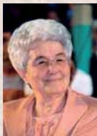
di Chiara Lubich